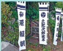
▲しとどのいわや 乗船場前、あるいて1分

寛平元年(889年)創建。 大国主神事代主神、少彦名神がまつられています。江戸時代には貴宮大明神と呼ばれていましたが、明治元年現在の名称になりました。毎年7月最終土曜日及びその前日に行われる貴船まつりは日本三大船祭りの1つとして有名で、同時に奉納される鹿島踊りとともに国の重要無形民俗文化財に指定されています。